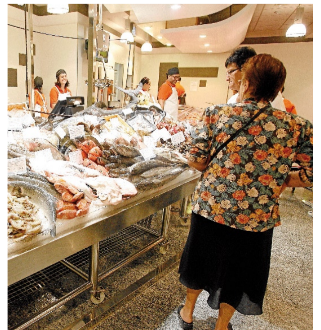
Pescadería de un súper en Compostela.

La cadena alemana distribuye sus centros por provincias con once en A Coruña, tres en Lugo, tres en Ourense y otros once en Pontevedra. A finales de este año abrirá una nueva tienda en Ferrol, en Santa Cecilia, en la que invertirá dos millones y que generará diez empleos. Hasta que abra, la superficie de ventas de las tiendas de Galicia supera los 34.000 m 2 . Lidl tiene una de sus plataformas logísticas en España en Narón que suma otros 31.000 m 2 entre oficinas y almacén y da soporte a las tiendas gallegas, asturianas y a parte de las de Castilla y León. Además de la inversión en nuevas tiendas, la mejora de las existentes en la comunidad propició actuaciones en 10 tiendas, lo que supuso una apuesta total de más de cinco millones.