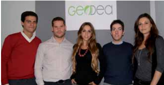
¡JÓVENES Y EMPRENDEDORES! ENTREVISTA AL EQUIPO DE GEODEA CONSULTORES 74