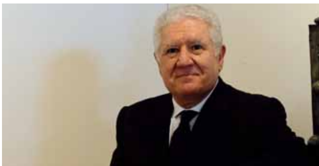
ENTREVISTA AL PUBLICISTA Y EMPRESARIO LUIS BASSAT 80